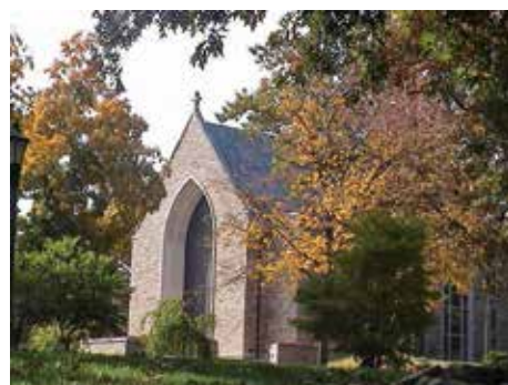
Concordia in 2002's Fall