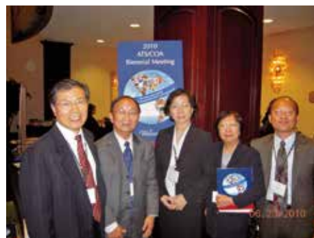
2010年6月攝於加拿大蒙特婁的ATS大會

主給我們的應許，不是很清楚嗎？「我是耶和華你的 神，曾把你從埃及地領上來；你要大大張口，我就給你充滿。」（詩八十一-10）「不是我們愛 神，乃是 神愛我們，差他的兒子為我們的罪作了挽回祭，這就是愛了。」（約壹四10）「不是你們揀選了我，是我揀選了你們，並且分派你們去結果子，叫你們的果子常存，使你們奉我的名，無論向父求什麼，他就賜給你們。」（約十五16）深願主使用這微小的器皿和他的家庭，使祂的名被傳揚，使祂的道被高舉，使祂的愛被豐富地經歷，使許多人歸向祂！