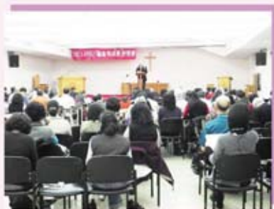
APELT「稱義與成長」研習會