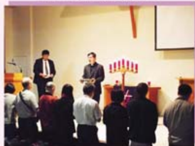
主立聖餐崇拜-領聖餐