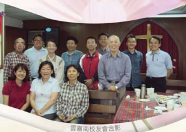
雲南兩校友會合影