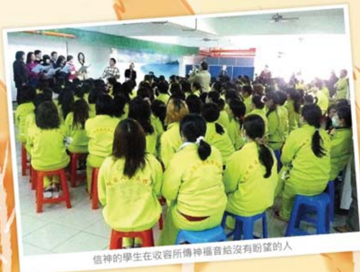
信神的學生在收容所傳福音給沒有盼望的人

當更多信徒們結出「聖靈的果子」，非信徒就會因著看見他們的美好生命，而被吸引來尋求神。聖經說：「當信徒的生命滿了神的愛，而且與主合一，活出愛世人的生命，他們將對神感興趣，來尋找神的愛。」(約17:23)