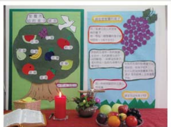
(圖一) 聖靈降臨節-角落禱告會其中一站