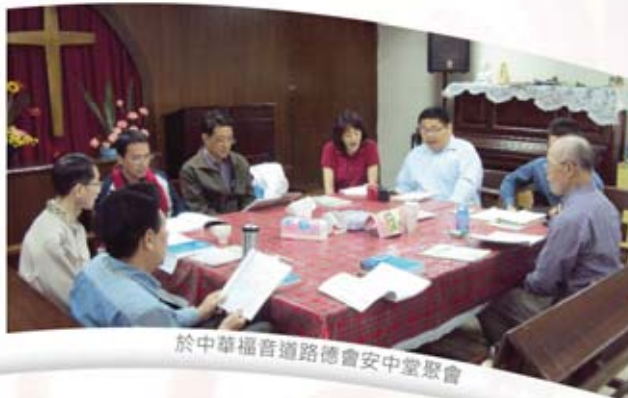
於中華福音道路德會安中堂聚會