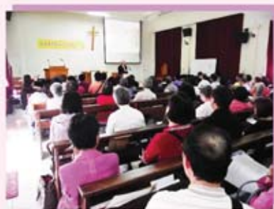
和合本修訂版介紹說明會