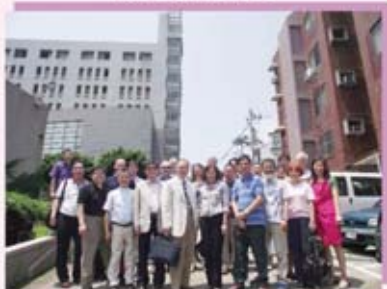
香港信義宗神學院來訪