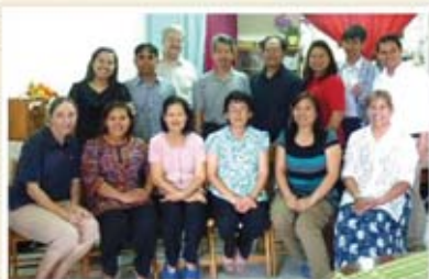
離開本國與本家的泰國宣教士

2. 感謝主！因為他們生命滿了神的愛，有七位泰國的牧師與傳道人，回應神的呼召，離開他的國家與家人，來到