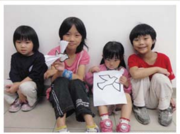
(圖二) 孩子們幫忙做鴿子佈置