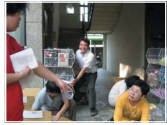
↑ 音樂會前的義賣品清點預備

社會上能成功的人，總有一些自己的堅持及對目標的熱忱；在某個領域有一番作為或專精的人，現代稱之為「達人」。在「信神」，我們期許自己能成為「信心達人」，學習亞伯拉罕對神全然的信靠，使我們個人在信仰、家庭、服事都可以全心倚賴我們的神；因為離了神，我們什麼都不能做。擴建的路尚漫長，但有主的應許，還有一群不論院內或院外「信心達人」的支持，聳立在高速公路旁的十架是越來越清晰、越來越近了。