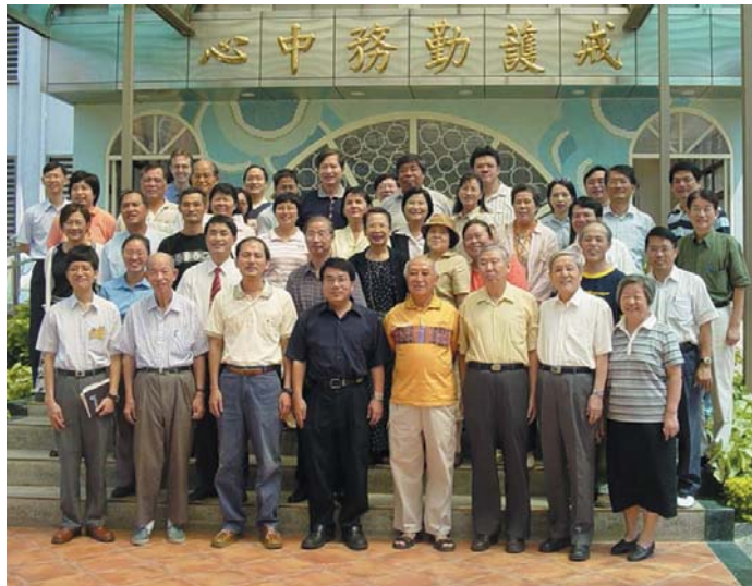
↑ 新竹同工聯禱會參與更生事奉

新竹同工聯禱會是一個尊重個別教會或機構異象的團隊，每屆的主席均委顧問牧師禱告推薦，並由眾教會代表選出。在歷年的主席及同工團隊用心服事下，每屆均呈現不同特色，例：有幾屆特重教會聯