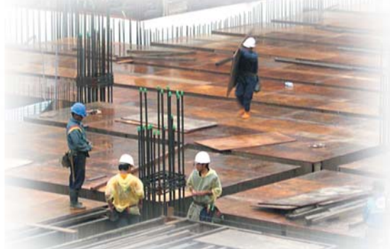
↑ 天候不穩，模板表面濕滑，工地施工需特別小心