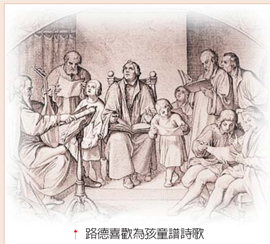
↑ 路德喜歡為孩童譜詩歌

路德認為沒有甚麼關係，也沒有甚麼友誼其佳美、信實、溫柔過於夫婦的婚姻生活。相反，世界痛苦的事也沒有過於恩