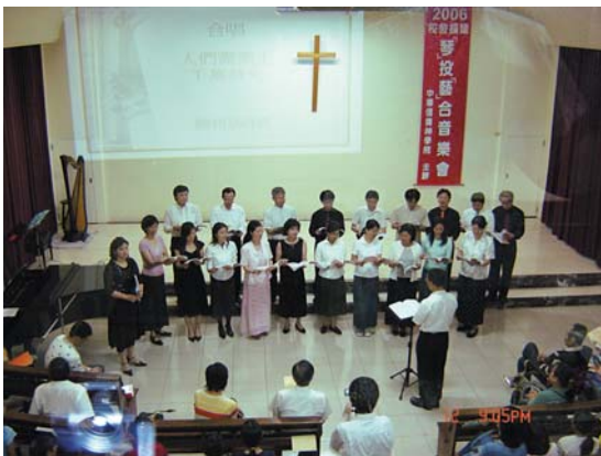
↑ 五場擴建音樂會所有表演者全是義務奉獻演出