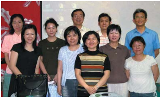
↑ 基宣豐原區輔導們於四月季後評估會後合影