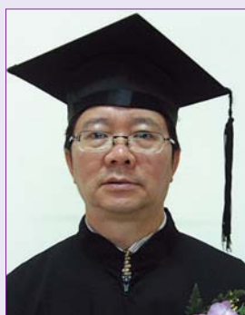
碩士部神學進修證書