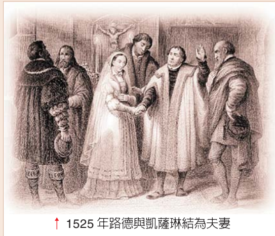
↑ 1525 年路德與凱薩琳結為夫妻

了兩年，兩度幫她撮合都沒有成功。路德事後才知道，原來凱薩琳波拉（Catherine von Bora）只屬意路德，不假二想。這讓路德心裏作難，因為他一直以為自己隨時都會被當作異端份子，而活活被燒死，因此從未考慮還有建立家室的可能性。後