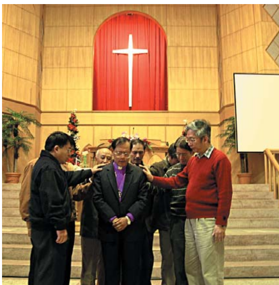
↑ 每屆主席均委顧問牧師禱告推薦，由眾教會選出

新竹區聯禱會共有122間教會，40所機構，她的成長，標誌了神的恩典，也使新竹成為蒙福的城市。歡迎您至大新竹區拓植教會或設立機構，加入同工聯禱會，讓我們同心合意，興旺福音。