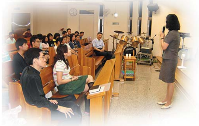
↑ 在嘉義舉辦的全職事奉體驗營及說明會