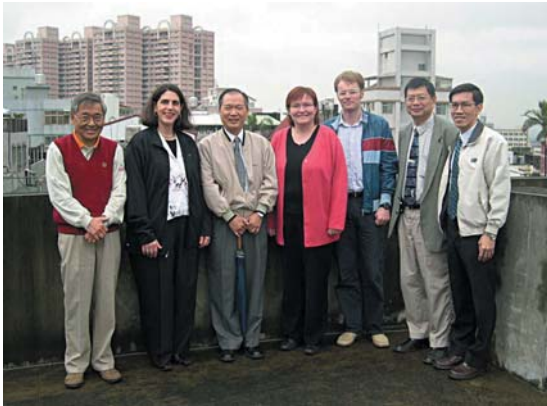
↑ 美國福音信義會蒞院參訪並關心學院擴建事工