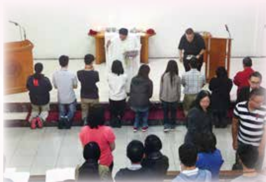
04/29 神學營舉行聖餐崇拜