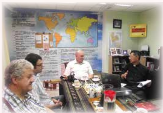
05/05 德國馬堡差會主管來訪