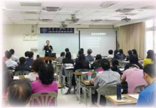
感謝主！4/28-4/29 神學營共有65位學員