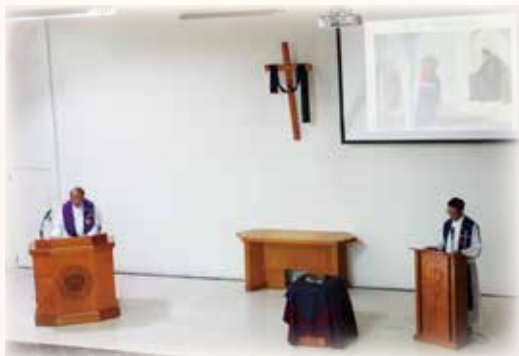
04/13 學院舉辦受難日崇拜